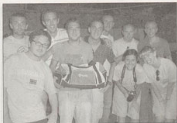
Le squadre triciclo