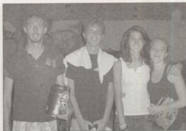
I vincitori di beach volley