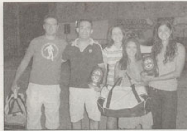
I secondi classifica nel beach volley

Si è conclusa domenica 22 luglio, all'oratorio di Borgomanero, la quinta edizione di Kabeba, manifestazione musicale e sportiva con tornei di calcetto (ca), beach volley (be) e basket (ba).