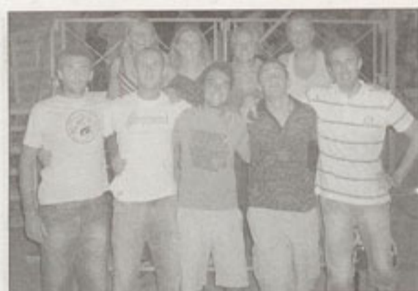
I terzi classificati nel basket