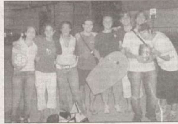
I vincitori del torneo di calcetto

Tutte le serate sono state rallegrate con della buona musica live a partire da giovedì 19 luglio con i Black Roses e i God Taxi