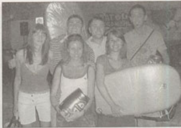
I vincitori nel basket