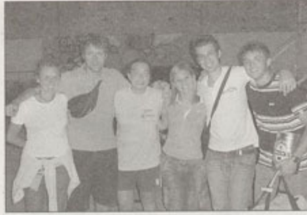
I secondi classificati nel basket