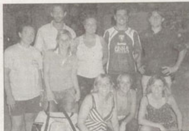
I secondi classificati nel calcetto