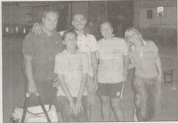
I terzi classificati nel calcetto