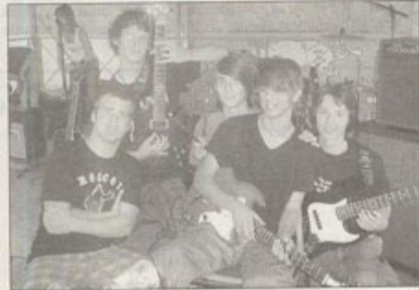
I God Taxi Driver