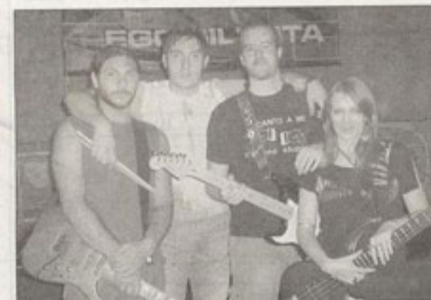
I Redo Silente