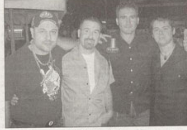
The Fabulous Fifties