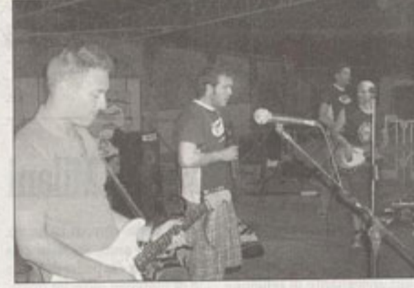
Gli Orario continuato